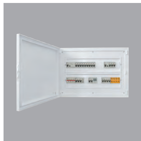
TABELA DE PREÇOS 2017/01/01